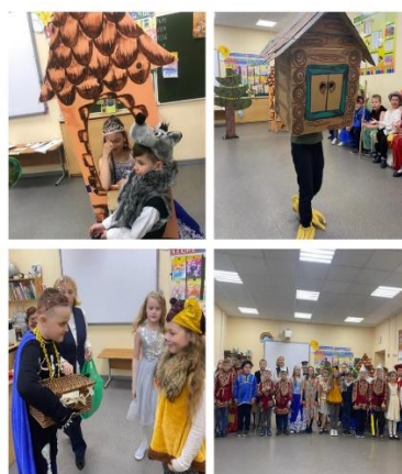
5 – драматический театр «У Лукоморья..» из поэмы «Руслан и Людмила