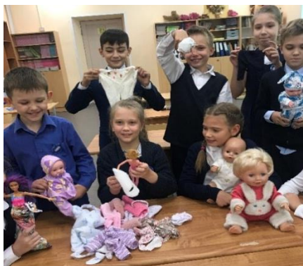
фото2 –театр игрушек