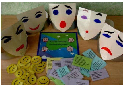
фото 1–театр картинок